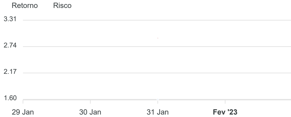
Gráfico comparativo Retorno x Meta Rentabilidade