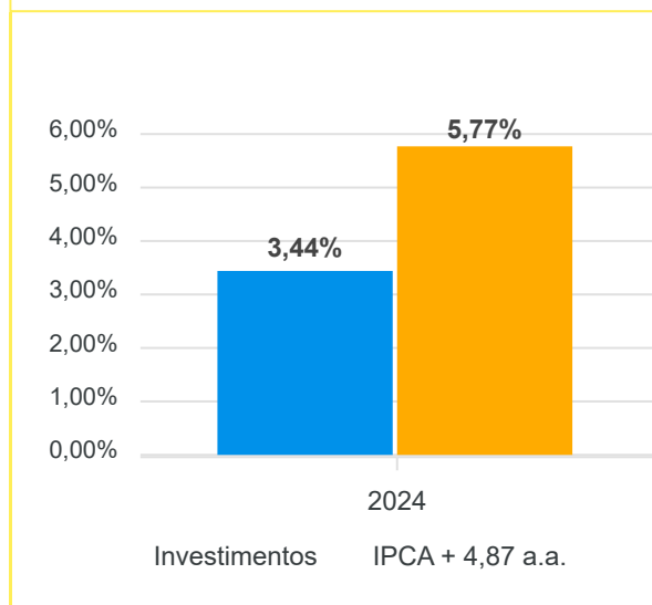
Gráfico Retorno e Meta Acumulado